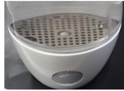
生成ボタンを連続で押す。