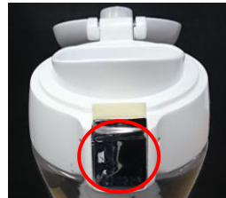
ロック解除状態でロックボタンを押すと蓋が開きます。